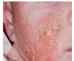
Infección bacteriana impétigo

LOS ANTIHISTAMÍNICOS NO reducen la picazón de la DA. Algunas marcas pueden usarse para ayudar a que el niño se duerma o para tratar las ronchas (urticaria).