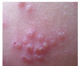
Infección cutánea por virus del herpes